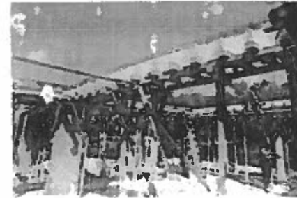
F5: Interior de cada