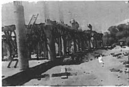
F1: Paredes principales