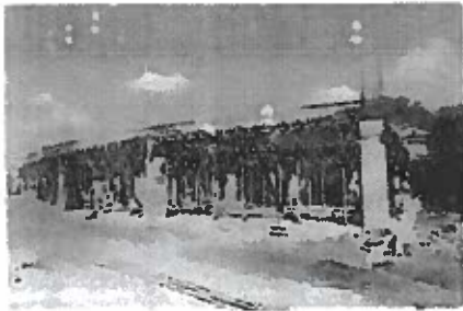
F3: Fachada posterior