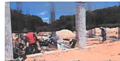
F5: Interior de aula