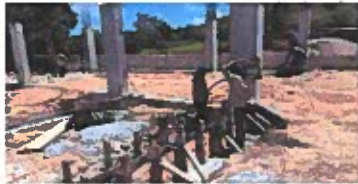
F1: Fachada posterior