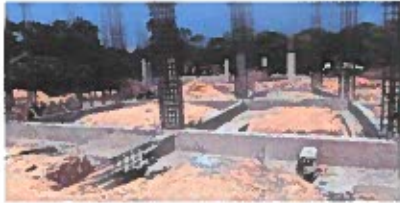
F3: Fachada principal