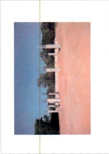
F1. Fachada principal