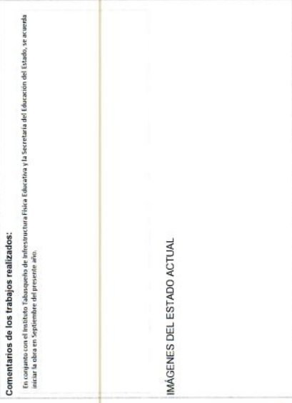
F3. Fachada posterior