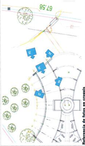
Referencia de fotos en croquis